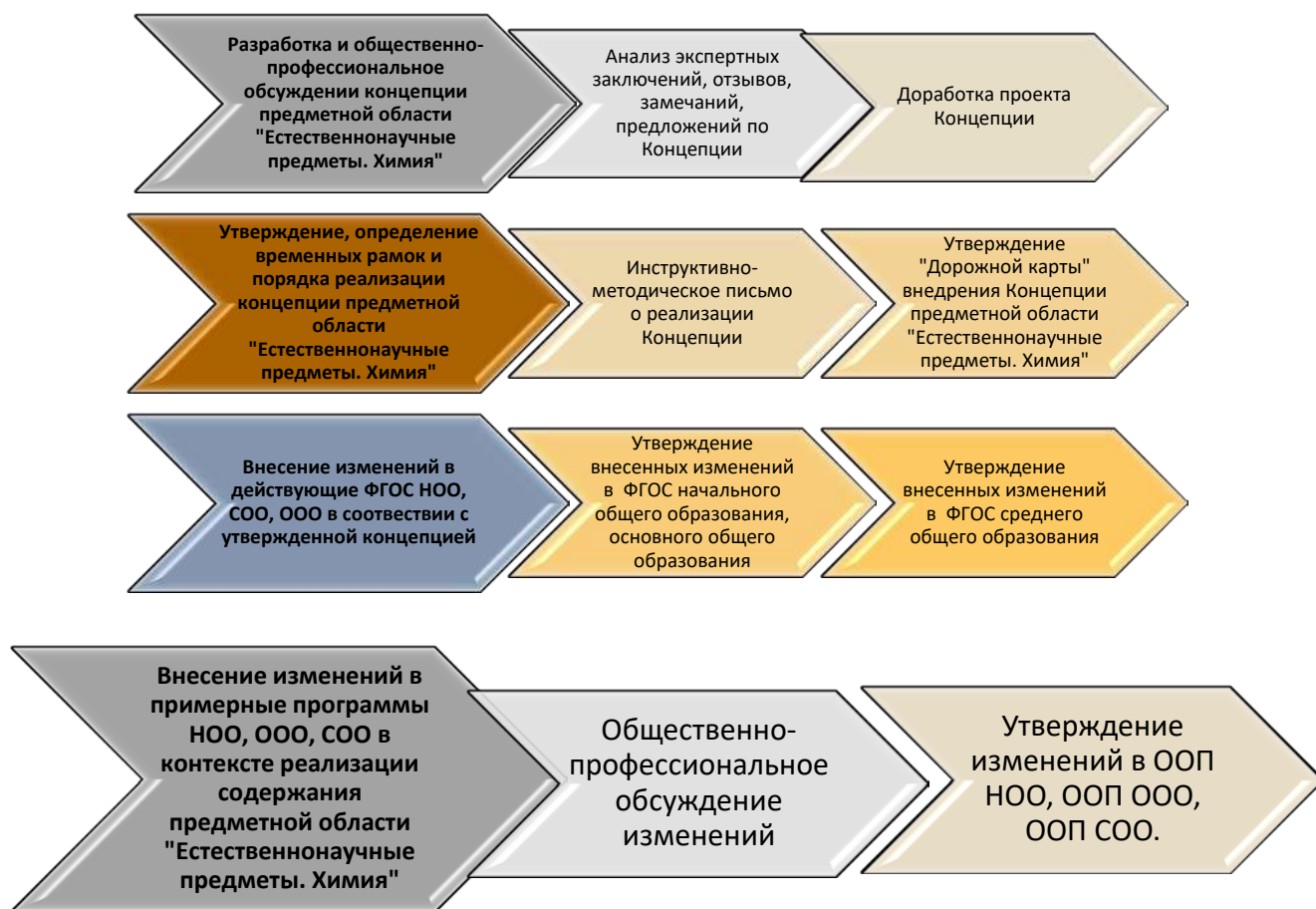
Рис. 2 Организационная схема процесса нормативно-правового и научно-методического обеспечения реализации Концепции предметной области «Естественнонаучные предметы. Химия»

Программное и информационно-ресурсное обеспечение образовательной деятельности в процессе реализации концепции предметной области «Естественнонаучные предметы. Химия» представлено в разделах: